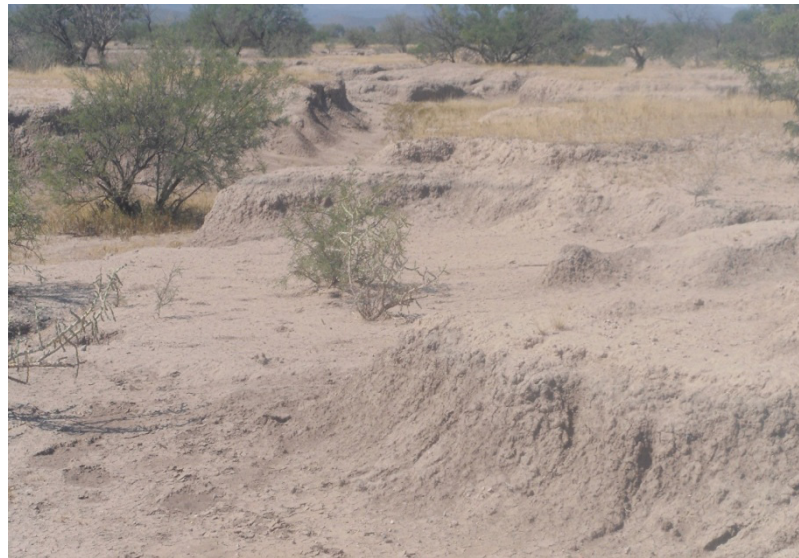
FIGURA 1. Área de pastizal nativo con erosión acelerada o en cárcavas en la región del municipio de San Luis del Cordero, Dgo. México.