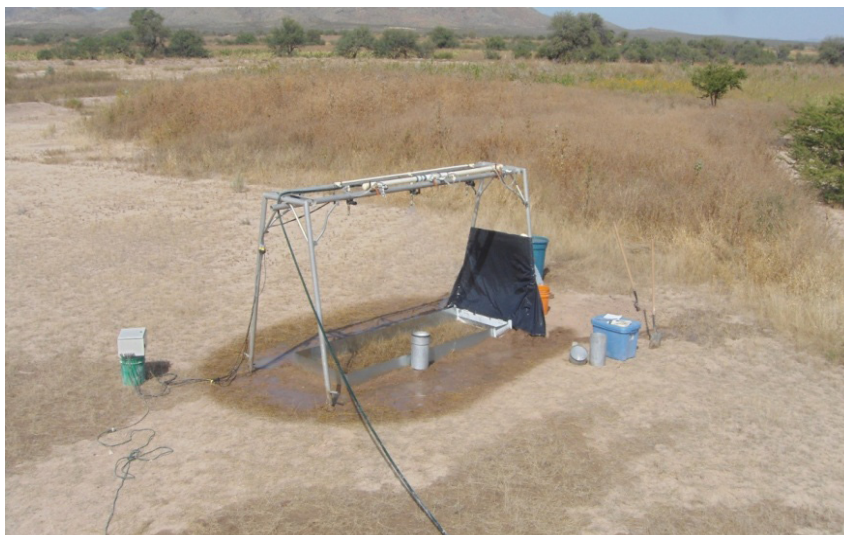
FIGURA 2. Simulador de lluvia modificado, tipo Miller (1987) utilizado en parcelas experimentales. FIGURE 2. Modified Miller rainfall simulator (1987) used in experimental plots.

104° 14' 57" LO) y rehabilitada como una pradera de zacate buffel ( Pennisetum ciliare L.) con 11 años de establecida. La pradera de zacate buffel (PZB) aparte de recibir la lámina precipitada o lluvia, una o varias veces al año se hacen aportaciones de agua a la pradera en forma de riego cuyo origen es la escorrentía proveniente del arroyo Naycha, el número de riegos aplicados a la parcela dependen del número de tormentas que originen avenidas en el arroyo mencionado. Al momento de las pruebas de simulación de lluvia la pradera de zacate buffel se encontraba en un estado fenológico de rebrotación, después de haber realizado un corte y b) un área de pastizal nativo de la región (25° 25' 18" LN y 104° 15' 29" LO), en el cual las especies dominantes en el estrato arbóreo son el mezquite ( Prosopis spp) y el huizache ( Acacia spp) y en el estrato basal se encontraron las especies de pasto de los Géneros Bouteloua , Lycurus y Aristida . El caso del pastizal nativo (PN) el régimen hídrico es totalmente de temporal; por ello, en la fecha de realización de las pruebas de infiltración las plantas en el estrato inferior se encontraban secas por su etapa fisiología y por la falta de humedad en el suelo (menor al 10 %, con base en peso seco).