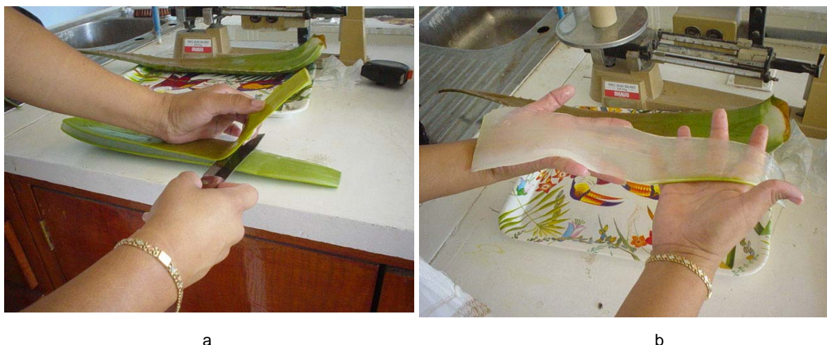
Figura 2. Proceso manual de fileteado de hoja de sábila: corte (a) y filete (b)

desarrollarse a bajas temperaturas para preservar los componentes naturales de la sábila. Los atomizadores funcionan convirtiendo el concentrado de sábila en una finísima niebla de gotitas. Las gotitas se forman cuando el concentrado se hace pasar a presión por una forma cónica y se encuentra con un flujo de aire caliente en una cámara. Esto resulta en la formación de gotas tan pequeñas que incrementan su cociente volumen/radio, facilitando la evaporación ya que las gotitas se suspenden dentro de la cámara hasta que se vuelven más densas debido a la evaporación. Una vez seca por evaporación, la parte sólida caen al fondo de la cámara en forma de polvo. Para lograr este paso, se cuenta con un dispositivo que contiene una válvula de alta presión (2000 psi) que impulsa al líquido a pasar por un orificio muy pequeño que provoca que el líquido salga en forma de una niebla muy fina. Otro dispositivo consiste en un disco al que se le lanza un chorro de líquido. La fuerza centrífuga del disco giratorio (10, 000 rpm) dispara el líquido, convirtiéndolo en una niebla fina.