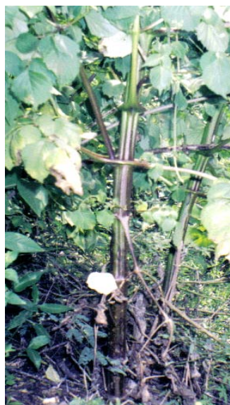
Figura 1. Tallo de D. campanulata

Las hojas de D. campanulata pueden llegar a medir hasta 60 cm de longitud, son bipinadas con pinnulas opuestas en el raquis, presentan estipulas, lo cual es una característica distintiva de esta especie, pueden presentar de 7 a 11 pinnulas primarias, folíolos aserrados de color verde, el color del raquis va de un verde muy