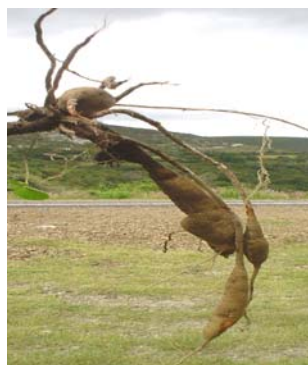
Figura 4. Raíz de D. campanulata