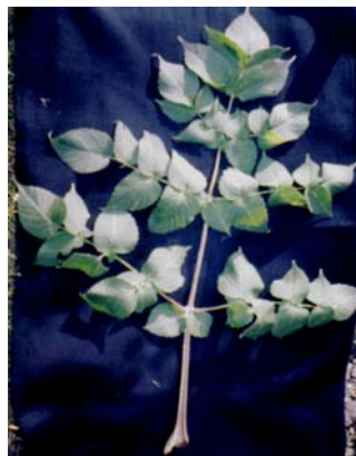
Figura 2. Hoja de D. campanulata