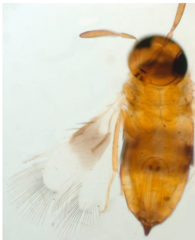
Figure 5: Adult female Signiphora sp. Figura 5: Adulto hembra de Signiphora sp.

En el Cuadro 1 se muestran los datos de emergencia de estos dos géneros parasitoides. El porcentaje de parasitismo combinado más alto se presentó el 12 de septiembre con un 62 %, y con excepción de las colectas realizadas en abril, el porcentaje de parasitismo combinado fluctuó del 6 al 41 %. Eretmocerus sp. tuvo la mayor emergencia con un total de 199 ejemplares, los cuales representaron el 67.2% del total de los parasitoides emergidos; además el promedio de parasitismo por este afelínido durante el periodo de colecta fue de 16.6 %, en tanto que el de Signiphora sp. fue de 8.1 %.