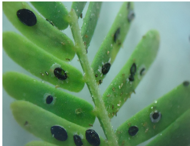
Figure 2. Tetraleurodes acaciae nymphs. Figura 2. Ninfas de Tetraleurodes acaciae

It was determined through the whitefly identification process that the species is Tetraleurodes acaciae (Quaintance) (Homoptera: Aleyrodidae), although in the list of plant species attacked by T. acaciae , reported by Evans (2007), huizache Acacia farnesiana (L.) Willd is not included. Likewise, the pest insects reported for