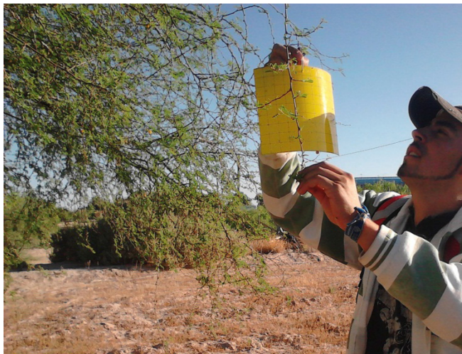
Figure 1. Placing yellow sticky trap in huizache. Figura 1. Colocación de trampa pegajosa amarilla en huizache.

The collected material was reviewed in a laboratory, finding mostly homopterans, mainly whitefly with a high degree of parasitism. Against this background, a biweekly whitefly sampling program was conducted from April to September 2013.