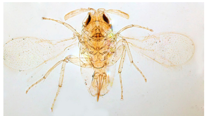
Figure 4. Adult female Eretmocerus sp.

Durante el periodo de muestreo antes referido y de las ninfas colectadas y encapsuladas, se revisó la emergencia de adultos de parasitoides, determinándose dos géneros, Eretmocerus sp. Haldeman 1850 (Hymenoptera: Chalcidoidea: Aphelinidae) (Figure 4) y Signiphora sp. (Hymenoptera: Chalcidoidea: Signiphoridae) (Figure 5).