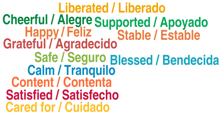
Figura 4. Cómo les hace sentir tener un ingreso por pensión (del bienestar) a las personas adultas mayores rurales.