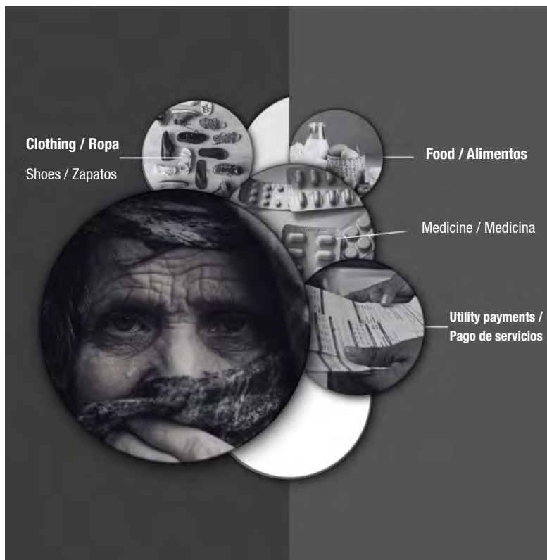
Figura 3. Cosas que pueden pagar o comprar las personas mayores rurales con la pensión del bienestar