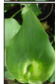
Etapa 3. La espata comienza su apertura.