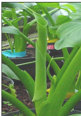
Etapa 1. Espata parcialmente cubierta por la hoja madre

Escapos florales provenientes de plantas tratadas con estiércol de bovino + pulpa de café (20, 30 y 50 %); Gallinaza + pulpa de café + bagazo de caña (20, 30 y 50 %); y suelo de la región + 12-11-18-3 (al suelo) + 20-30-10 + Organozymba® (foliar) fueron colocados en frascos de vidrio de 1 litro de capacidad que contenían agua corriente. Los escapos florales fueron cosechados con espatas totalmente abiertas y cuando el espádice se encontraba liberando polen (Figura 1, etapa 6). Se utilizó un diseño de bloques al azar con cuatro repeticiones y la unidad experimental fue un frasco