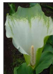
Etapa 6. Espata completamente abierta y espádice con polen.