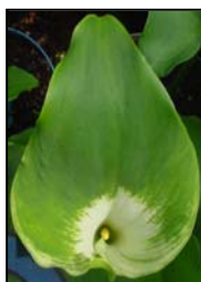
Etapa 4. Espata abriendo y espádice visible.