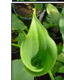
Etapa 2. Espata cerrada y cubriendo el espádice, pedúnculo visible.