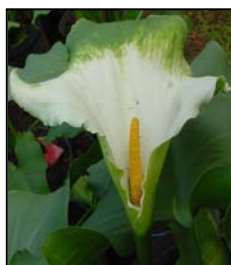
Etapa 7. Espata completamente abierta y el polen del espádice liberado.