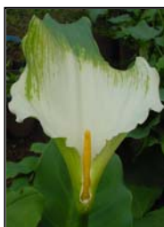
Etapa 5. Espata completamente abierta y espádice sin polen.