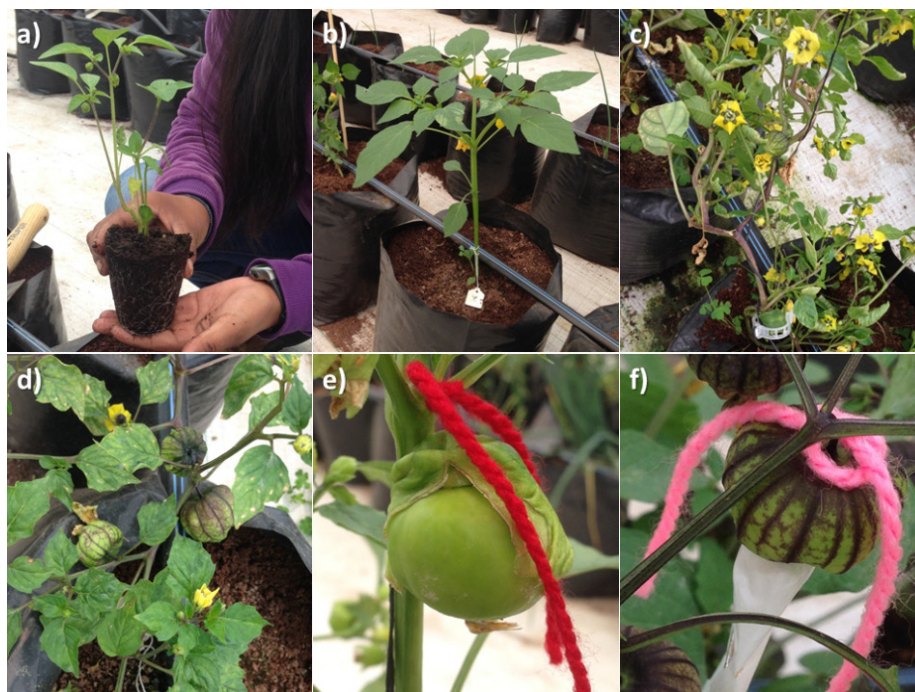
Figure 3. Acclimatized plants grown under greenhouse conditions. a) Plant from family 2b of Morado San Miguel, b) plant from family 2 of Manzano Tepetlixpa, c) flowers from family 1 of Morado San Miguel at 75 days after acclimatization, d) fruits from family 2b of Morado San Miguel, e) fruit from the Tecozautla 3 x Manzano Tepetlixpa 2 interclonal cross and f) fruit from the Morado San Miguel 1 x Morado San Miguel 2a interclonal cross.

De lo anterior, se puede afirmar que las variables evaluadas y su expresión obedecen, principalmente, al hábito de crecimiento de cada variedad. Respecto al número de bolsas y flores, las familias de Morado San Miguel expresaron el mayor valor, esto como resultado de un mayor nivel de ramificación presente por su hábito rastrero, lo cual significa que producen más frutos, pero de menor tamaño (Cartujano et al., 1987; Peña-Lomelí et al., 2014). En cuanto a la altura, y al número de hojas y de flores, se puede confirmar que las plantas provenientes de cultivo in vitro presentan un menor valor en comparación con las plantas provenientes de semilla. No obstante, el ciclo de vida de las plantas obtenidas por propagación in vitro comprendió alrededor de 98 días, contados a partir del cultivo in vitro en el laboratorio hasta el desarrollo de los primeros frutos.