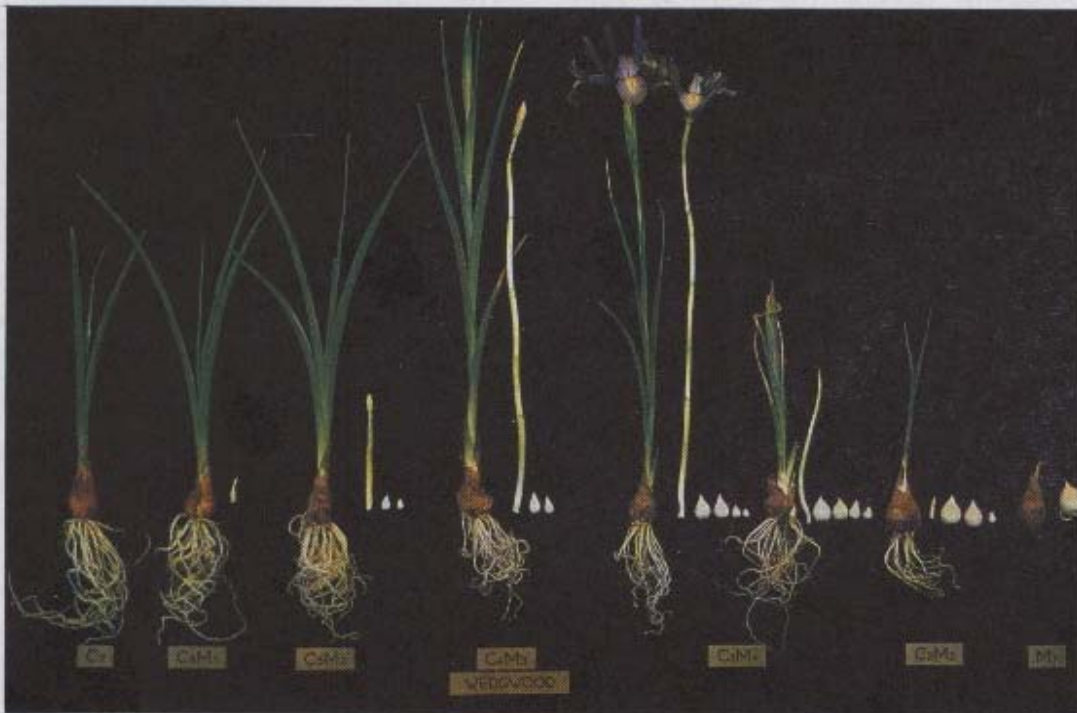
Fig. 2. Iris; élongation des organes aériens et des racines, et grossissement des bulbes-fils chez des plantes produites par des bulbes conservés à 30°C (à gauche) ou pendant (de gauche à droite) 4, 8, 12, 16, 20 et 28 semaines à 10°C, avant plantation à 15°C, cv. "Wedgwood".

- la prolongation du traitement à 5°C provoque d'abord un effet bénéfique sur la floraison puis un effet négatif, la bulbification devenant le principal processus de croissance quand le traitement se prolonge au delà de 6 mois.