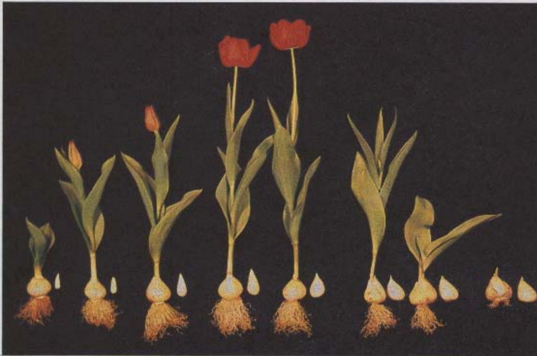
Fig. 1. Tulipe: élongation du bourgeon floral et des racines, et grossissement du bourgeon végétatif le plus interne chez des plantes produites par des bulbes conservés à 20°C (plante de gauche) ou pendant (de gauche à droite) 2, 3, 4, 5, 6 (2 plantes) et 7 mois à 5°C, cv. Paul Richter; plantation à 18°-20°C.

- la prolongation du traitement à 5°C provoque d'abord un effet bénéfique sur la floraison puis un effet négatif, la bulbification devenant le principal processus de croissance quand le traitement se prolonge au delà de 6 mois.