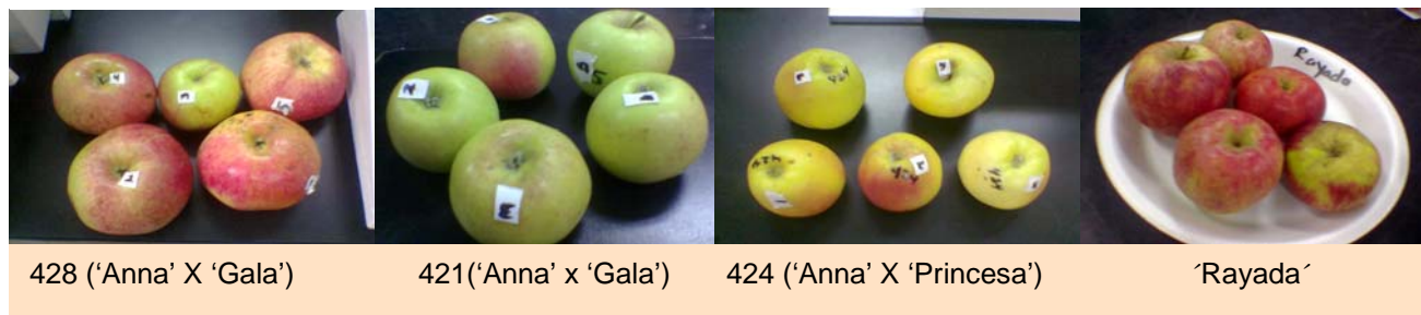
FIGURA 2. Genotipos de manzana de maduración temprana sobresalientes en 2006.

En el otro extremo se encuentran los genotipos 419 (69.8 % de "canica"), SM2, 129 y 419, que sin poseer frutos "Extra", obtienen altos porcentajes de frutos de tipo "canica". Estos últimos genotipos no tendrían, en principio, mayores posibilidades comerciales a nivel regional. A excepción de 'Lourdes', todos los genotipos muestran frutos de forma